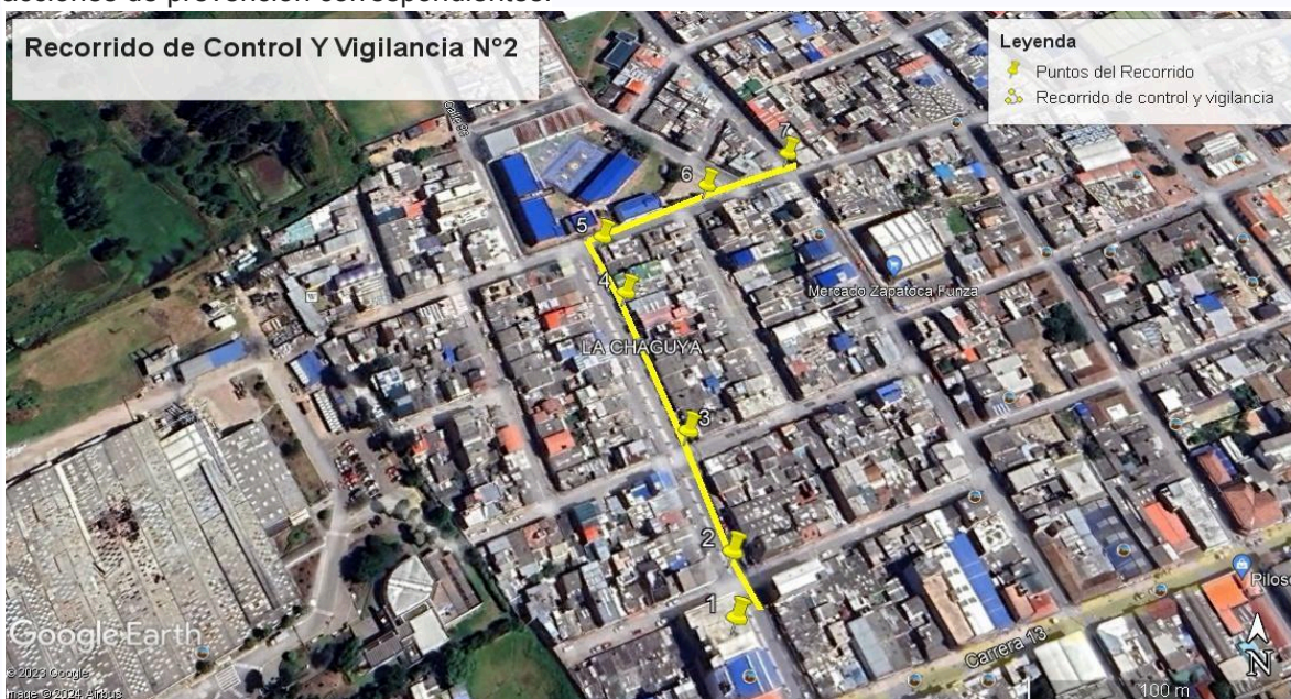
Ilustración 1. Recorrido de Control Y Vigilancia N°2

Se realizó recorrido de control y vigilancia en el cuadrante 3, barrio La Chaguya el día 18 de abril del 2024, desde las coordenadas 4°42'55,068" N- 74°12'54.174" 'W hasta las coordenadas 4°43'2,436" N- 74°12'53.136"W (ver ilustración 1. Ruta amarilla), con el fin de verificar las condiciones ambientales, identificar posibles afectaciones a los recursos naturales y realizar las acciones de prevención correspondientes.